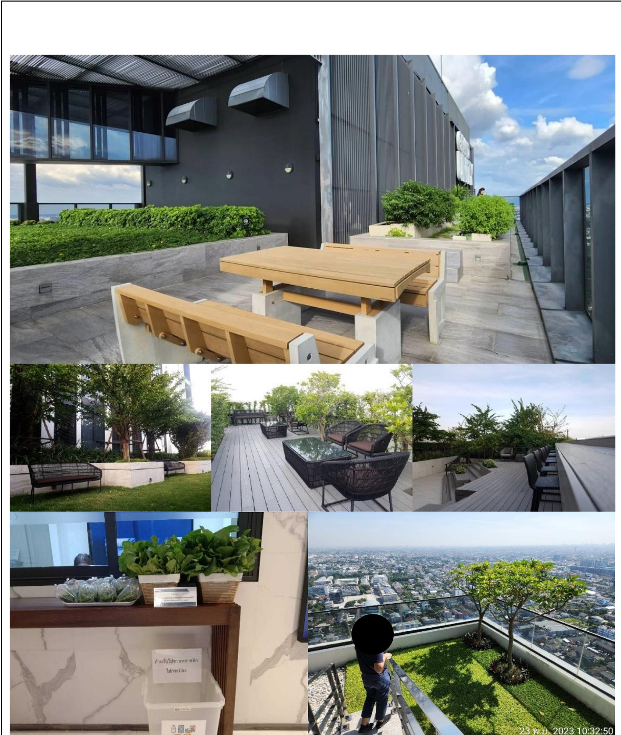
รูปที่ 1.6-1 แสดงสถานภาพปัจจุบันของโครงการ (ช่วงเดือนกรกฎาคม – ธันวาคม 2566)

โครงการ แมสซารีน รัชโยธิน (MAZARINE Ratchayothin) ได้เปิดดำเนินการแล้ว (ดังรูปที่ 1.6-1)